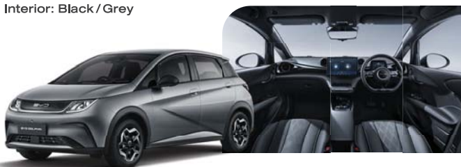
Exterior: Graphite Grey Interior: Black / Grey