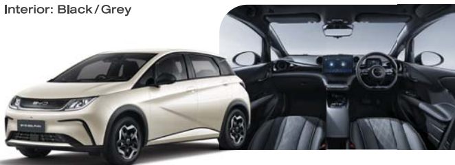
Exterior: Coastal Cream Interior: Black / Grey