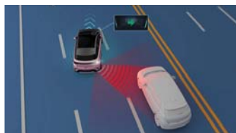
Lane Change Collision Warning (LCW) ระบบช่วยเตือนการชนเมื่อเปลี่ยนช่องทางเดินรถ