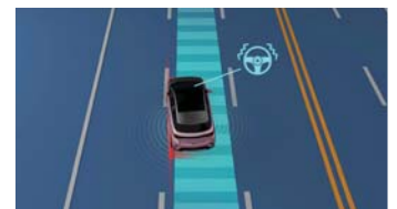
Lane Departure Warning (LDW) ระบบช่วยเตือนเมื่อรถออกนอกเลน