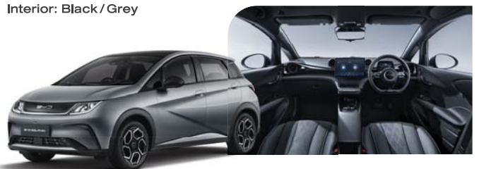
Exterior: Graphite Grey Interior: Black / Grey