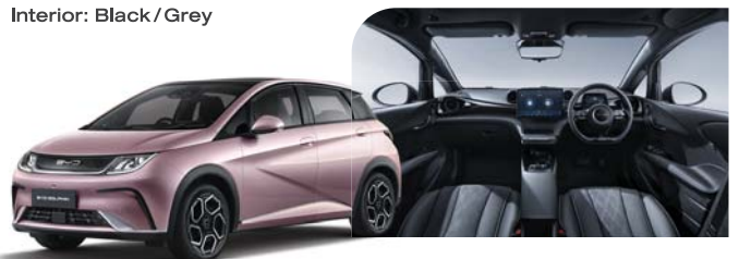
Exterior: Coral Pink Interior: Black / Grey