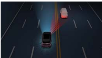
Adaptive Front Light (AFL) ระบบช่วยเปิด - ปิดไฟหน้าอัตโนมัติ

กล้องมองภาพรอบคัน 360 องศา เห็นครบทุกมุมมอง ชัดเจนทุกองศา มั่นใจ ไม่พลาดทุกจุดรอบคัน