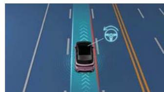
Lane Departure Prevention (LDP) ระบบป้องกันรถเบี่ยงออกนอกเลน