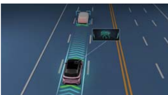
Adaptive Cruise Control with Stop and Go Function (ACC-S&G) ระบบช่วยควบคุมความเร็วอัตโนมัติแบบแปรผัน พร้อมฟังก์ชัน Stop and Go