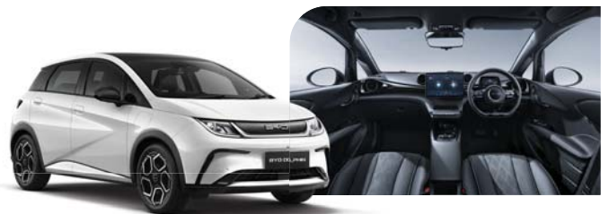
Exterior: Frost White Interior: Black / Grey