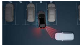
Rear Cross Traffic Alert and Braking (RCTA + RCTB) ระบบช่วยเตือนและระบบช่วยเบรกเมื่อมีรถผ่านในจุดอับสายตาขณะถอยหลัง