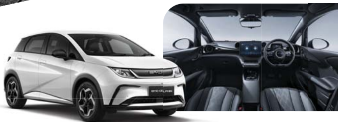
Exterior: Frost White Interior: Black / Grey