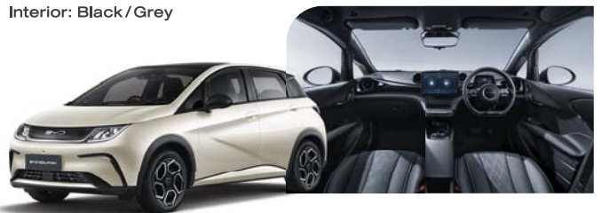
Exterior: Coastal Cream Interior: Black / Grey