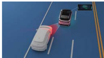
Blind Spot Detection (BSD) ระบบช่วยเตือนจุดอับสายตา